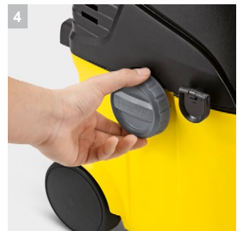
4 Атрактивен дизайн с големи бутони и удобни капачки