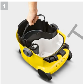
1 Система с два резервоара

Перяща прахосмукачка за хигиенично основно почистване на килими и твърди подови настилки. Може да се използва и като прахосмукачка за сухо/мокро изсмукване.